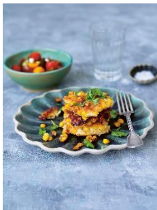
Maispuffer mit Tomaten-Salat