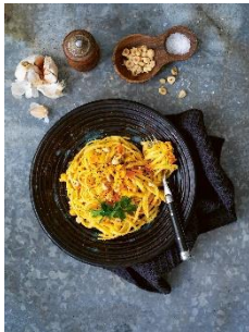
Pasta mit Karotten-Pesto