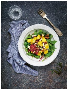
Gnocchi mit Rote-Bete- Pesto