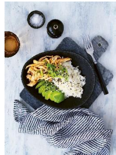
Kokosreis mit Avocado und Huhn