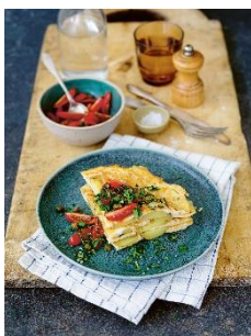
Tortilla mit Tomatensalat