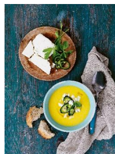
Maissuppe Jalapeno

Weitere Informationen und Bildmaterial können Sie gerne anfordern bei: