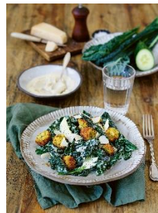
Cesar Salad mit Falafel